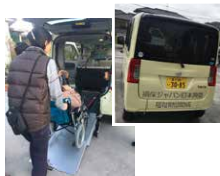
2018年度 自動車購入費助成先 ＜特定非営利活動法人 手と手と手＞