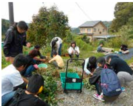
＜日常生活支援サポートハウス＞