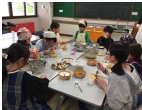
2018年度 NPO基盤強化資金助成先 ＜サタデースクール＞