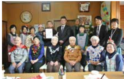
ちいきカフェ “円と縁”