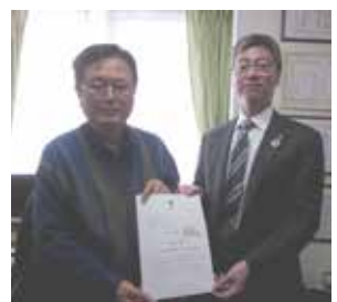
特定非営利活動法人 救命のリレー普及会