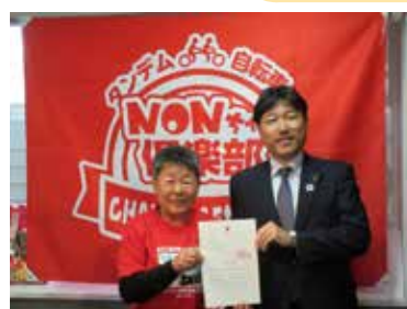
特定非営利活動法人 タンDEM自転車NONちゃん倶楽部