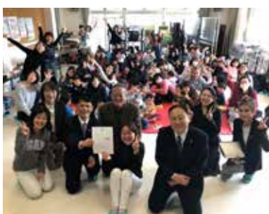
特定非営利活動法人 くさつ未来プロジェクト