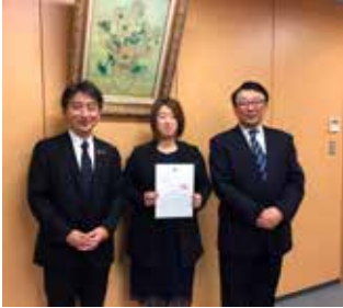
特定非営利活動法人 あきた冒険遊びfrog