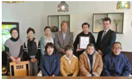
特定非営利活動法人 地域生活相互支援大山田ノンフェール・くらねえ