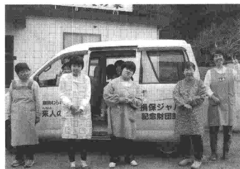
1. (3) 平成15年度自動車購入費助成先 《 能勢むらびと福祉会 》