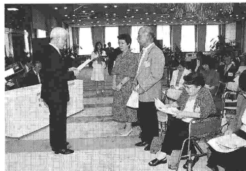
1. (1) 「平成15年度NPO法人設立資金助成」贈呈式 (平成15年7月23日 本社43Fホールにて)