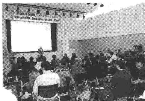
1. (4) 平成15年度会議会合・国際交流費助成先 「無痛無汗症 国際シンポジウム 2003」 (平成15年11月23日)