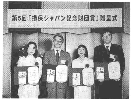
第5回「損保ジャパン記念財団賞」贈呈式 (平成16年3月25日 本社43階にて)