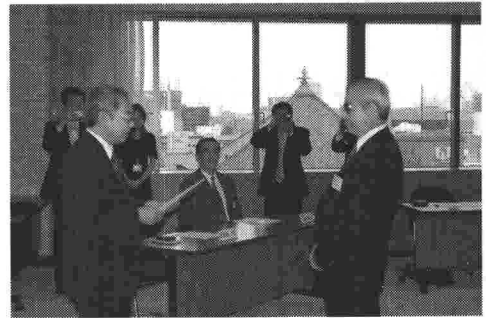
近畿本部で行われた贈呈式 (平成15年7月29日 近畿本部ビルにて)