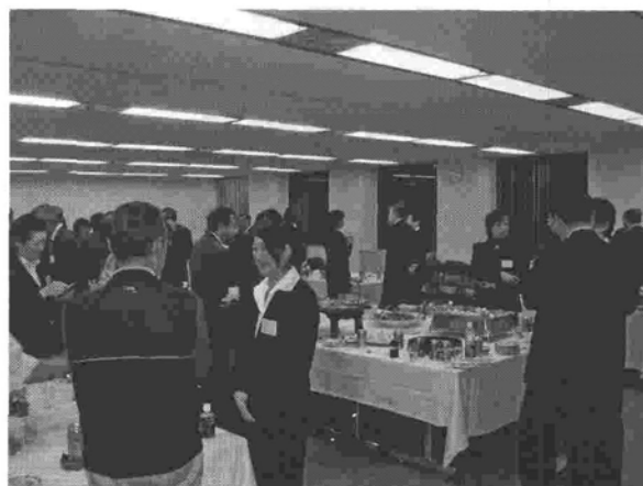
シンポジウム終了後の懇親会の様子