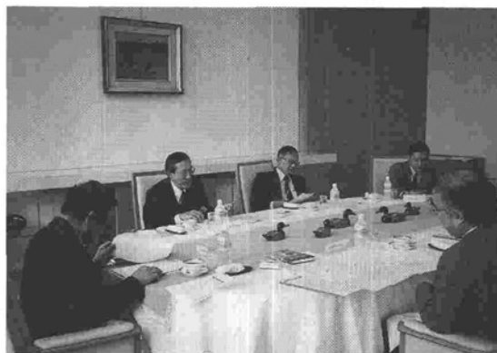
3月7日（火）の選考委員会の様子

ノルディック5カ国のなかでも、スウェーデン・デンマークとは一味違ったフィンランドの高齢者保健福祉政策の動向は注目されていたところである。それにも関わらず前記両国に比べて、その実態は必ずしもわが国では詳しくは知られていない。申請者の今回の研究内容は一面ではフィンランドの高齢者、障害者ケアの一端を明らかにしてくれるだけでなく、わが国とフィンランドの大学・研究所が共同で進めてきている「総合的ケア」の国際モデルの構築に向けての多面的研究を促進するものである。その意味でこの研究はわが国の高齢者、障害者ケアの政策的、実践面で参考になるだけでなく、高齢者・障害者ケアに関する研究として注目できるものである。今回は限られた日程と限られた助成金額などを考慮し、両国の研究者が一同に会し、それぞれの研究の経過、成果あるいは今後の課題などをグループ討議によって明らかにしようとするもので適切な研究計画と認められる。