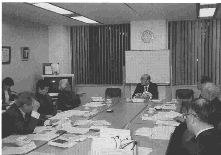
1月14日（土）17:00から開催された 第3回審査委員会の様子