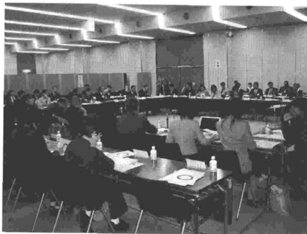
シンポジウム会場の様子

これだけの多分野から参加者が集まる会議もめずらしく、三位一体の改革・地方分権政策が進行していく中であって、地域の課題に取り組むNPOと新しいパートナーシップ関係を強化していくために、助成財団・支援団体・行政・企業とNPOが何を考えたらいいか、意見交換をする貴重な機会となり、シンポジウム終了後の交流会でも親しく情報交換がなされました。