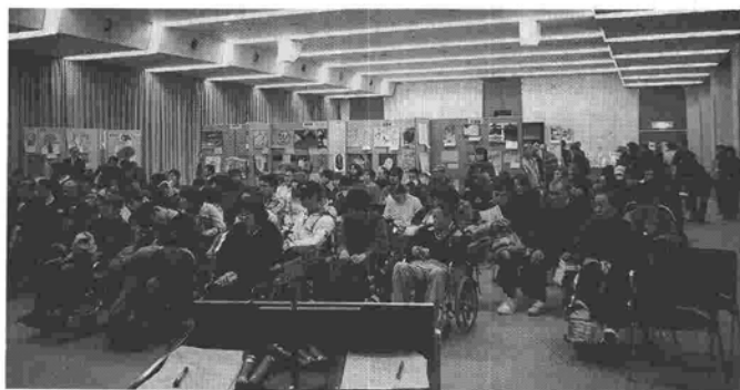
150名を超える方々の参加を得て開かれたギャラリートーク